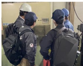
省エネ診断の様子