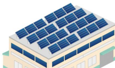
太陽光パネルイメージ(フリー画像)