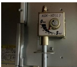
インバーターコントローラー