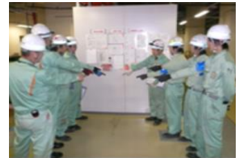
省エネお助け隊 職員

脱炭素宣言はしたが、この後どう進めていけばいいの?という中小企業の声を聞き、省エネお助け隊として、実現可能な省エネ・CO2削減の対策支援・伴走を行ってまいります。