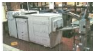
簡易操作型の印刷機

また、省エネのみならず簡易操作可能な機種へ更新したため、労働時間を軽減することができた。さらに、簡易操作型になったことにより、障がい者の雇用も今後視野に入れている。