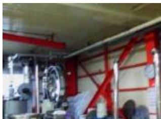
蒸気配管・バルブ類のサーモカメラの画像