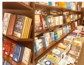
店舗照明の照度の状況